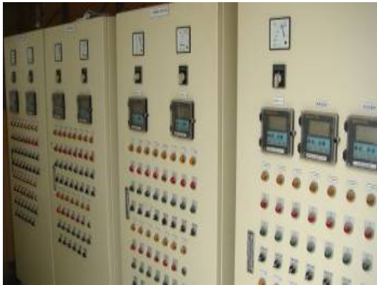
图三：污水处理控制系统