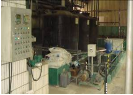
图一：污水处理系统