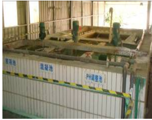
图二：污水处理系统