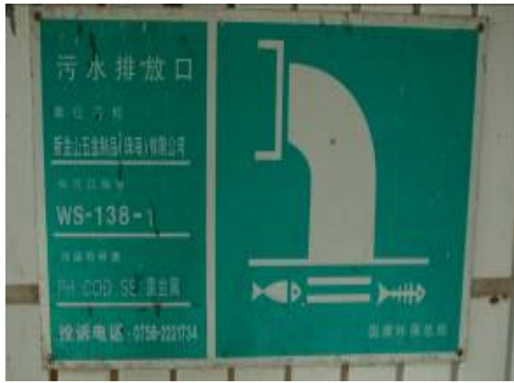
图五：污水排放口标示