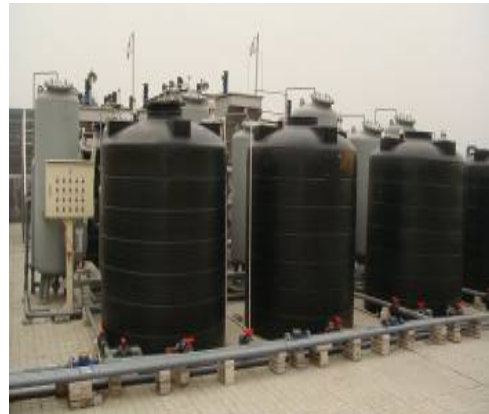
图七：废水储水罐循环回收系统